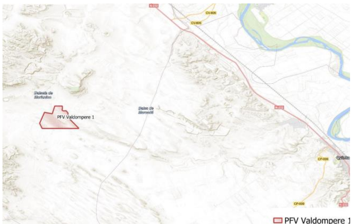
Figura 1 Localización del proyecto

Se localiza a 7 km al sureste de esta localidad sobre parcelas dedicadas al cultivo de cereal de secano en extensivo. El paraje donde se ubica la planta (Figura 1) se denomina "Valdecara" y se encuentra a 350 msnm aproximadamente.