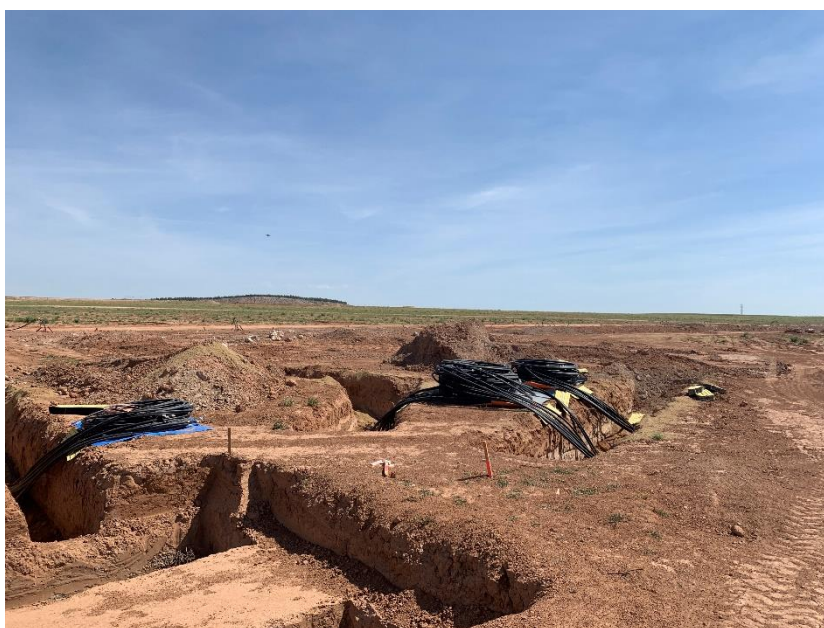
Figura 2 Apertura de zanjas para la RMT

Durante este mes se ha continuado con las labores de movimientos de tierras, apertura de zanjas de la red de media y baja tensión (Figura 2)