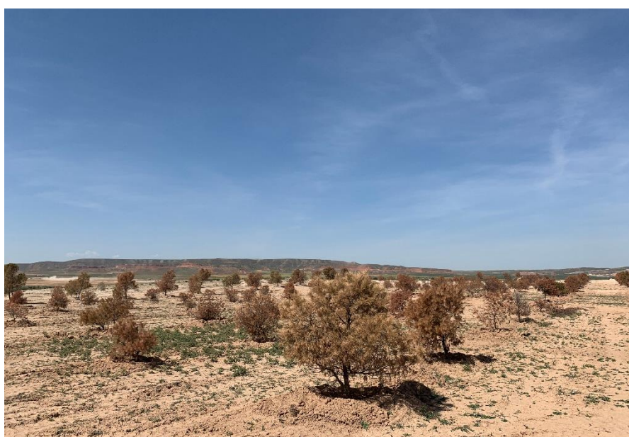
Figura 5 Masa de pinar trasplantada