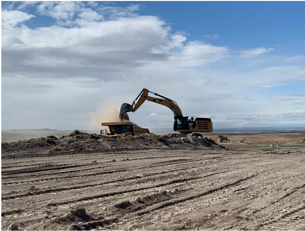
Figura 6 Movimiento de tierras