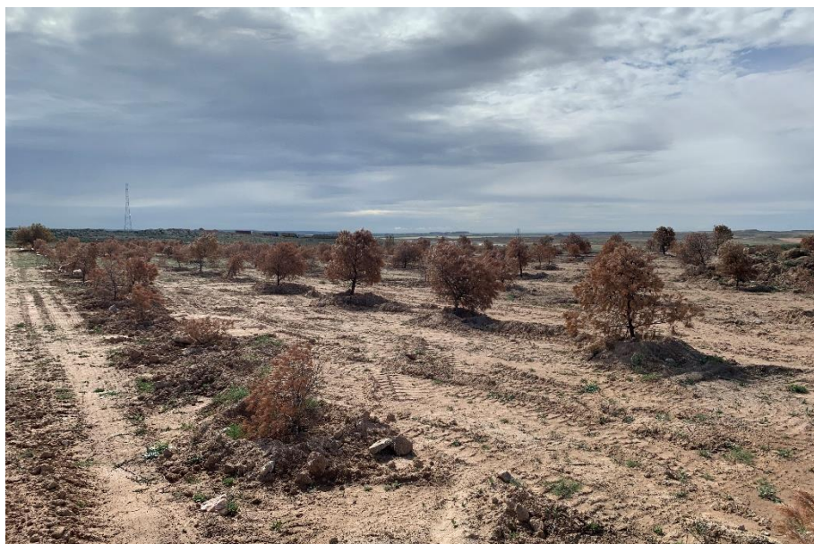
Figura 4 Masa de pinar trasplantada

El presente anexo se compone de un número representativo de fotografías del total realizado durante el periodo evaluado, escogidas por su relevancia y/o carácter explicativo para la correcta comprensión del presente informe.