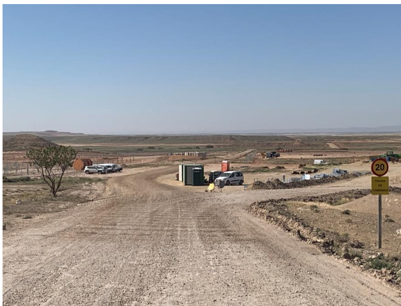
Figura 3 Señalización en obra

La obra dispone de cuba de agua y se realizan riesgos con regularidad. Además, la obra cuenta con un límite de velocidad establecido de 20km/h para reducir de esta forma las emisiones de polvo.