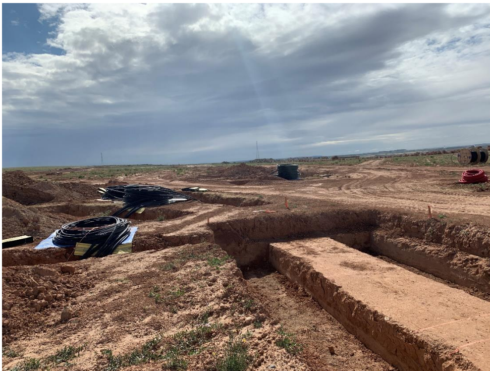
Figura 7 Apertura de zanjas